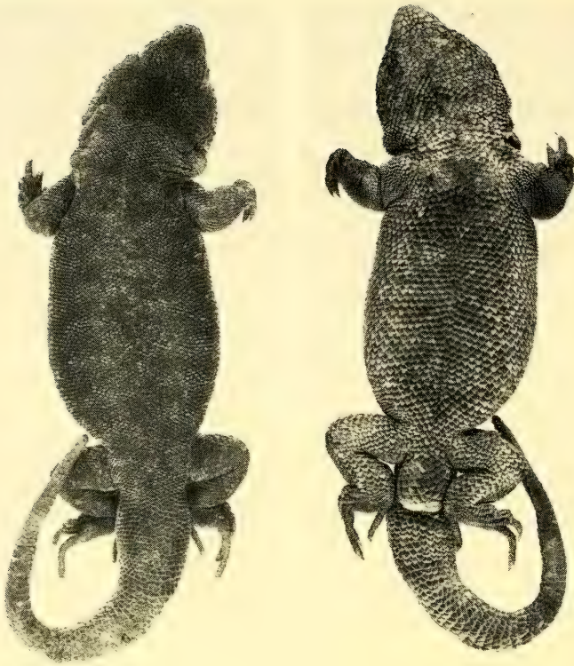
Fig. 1: Liolaemus forsteri sp. n. Holotype A. Vue dorsale; B. Vue ventrale.

Description: Narines obliquement orientées vers les côtés et le dessus. Rostrale environ deux fois plus large que haute. Ecailles de la tête, bombées et cabossées. Deux internasales bordant la rostrale, suivies de 4 écailles dont les 2 externes (supranasales) sont allongées. Entre ces écailles et les préfrontales, à peine reconnaissables, une zone vaguement pentagonale comprenant 17 écailles irrégulières parmi lesquelles on peut distinguer 3 impaires et 6 paires, plus 2 écailles intercalaires petites et asymétriques. Frontale divisée en trois, dont la portion antérieure creusée de deux sillons en y, et deux portions postérieures, celles-ci séparée des écailles pariétales par un groupe de 5 écailles. Interpariétale pyriforme et déprimée, suivie d'une petite écaille comprimée latéralement, elle-même flanquée de deux écailles relativement grandes et hautes qui semblent être les pariétales. Cinq sus-oculaires, séparées de la zone frontale (interorbitaire) par une rangée d'écailles et des surciliaires par 3 rangées d'écailles. 9 à 11 surciliaires, divisées en 1) un groupe antérieur de 5 ou 6 dont la première s'étend sur la région frénale, étant séparée de la nasale par deux écailles, les suivantes se recouvrant jusqu'à la dernière et 2) en groupe postérieur de 4 ou 5 qui se suivent plus ou moins normalement. Une seule série d'écailles entre la sous-oculaire et les labiales supérieures. 11–12 labiales supérieures, bordées d'autres écailles intrabuccales plus peti-